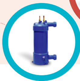
AQUECIMENTO DE PISCINAS

O Bloco Solar é uma unidade do Sistema Solar Termodinâmico tem como componentes principais um compressor de baixo consumo, que está encarregue da circulação do fluido através de todo o sistema, um permutador de calor que dissipa o calor para a água de consumo (Águas Quentes Sanitárias) ou circuito fechado de aquecimento (Aquecimento Central e Piscinas) e um componente de expansão que diminui a temperatura de ebulição de aproximadamente - 30°C para este regressar aos painéis solares termodinâmicos e voltar a captar calor.