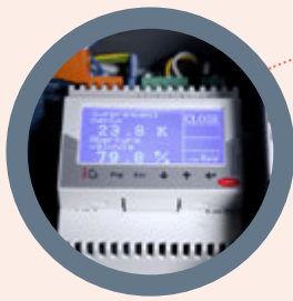
VÁLVULA DE EXPANSÃO ELECTRÓNICA