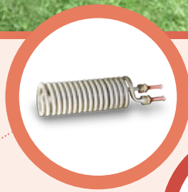
ÁGUAS QUENTES SANITÁRIAS USO INDUSTRIAL